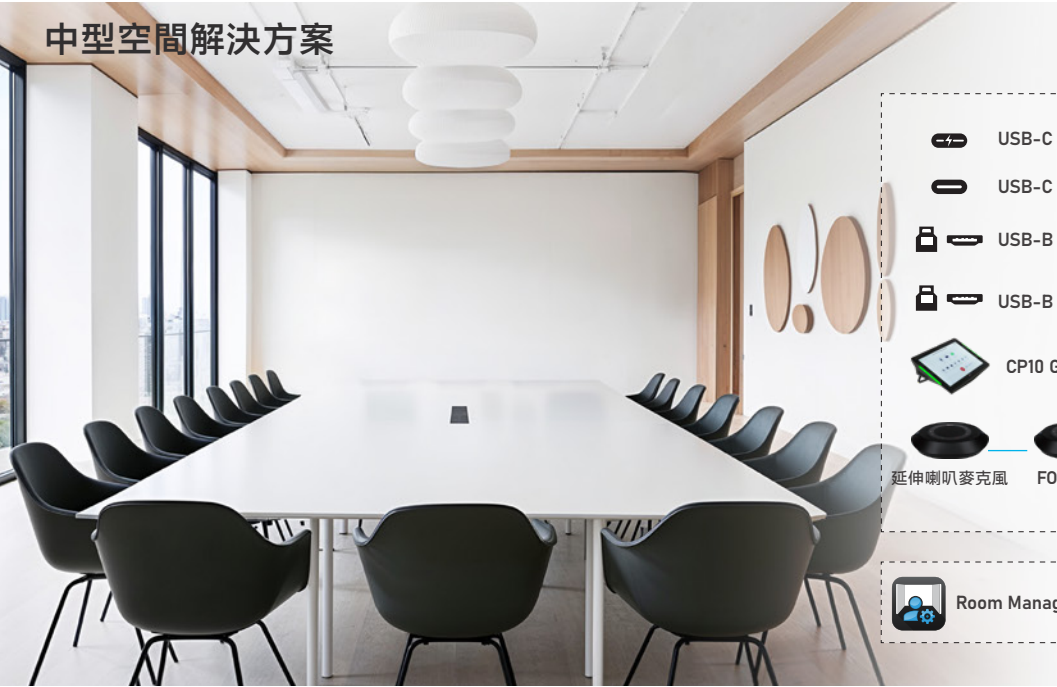
中型空間解決方案