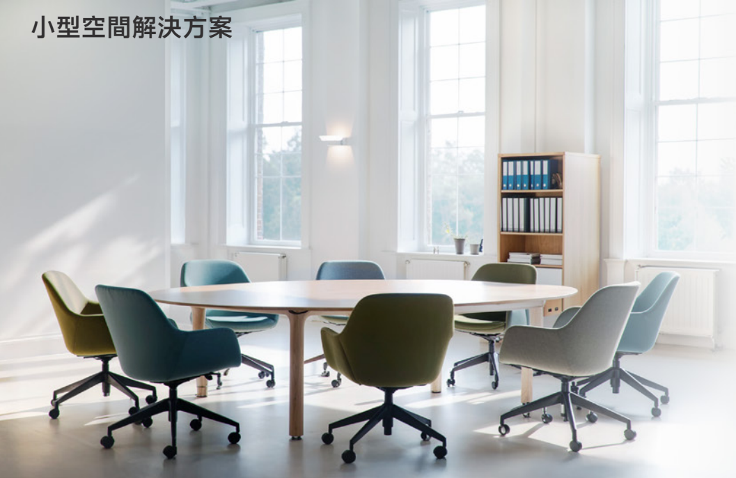
小型空間解決方案