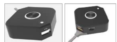
USB for Mobile