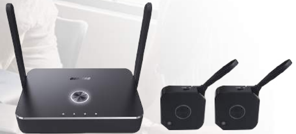
A QuattroPod mini Set contains 1 Receiver (RX) and 2 Transmitters (TX).